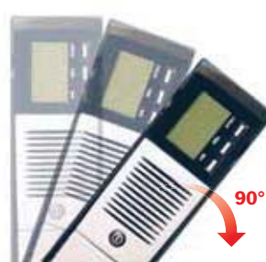
3. Die USV um 90° drehen