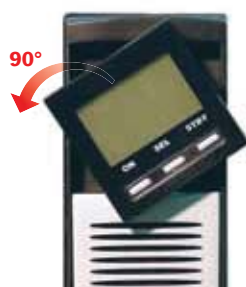
2. Die Anzeige drehen und in ihren Sitz einfügen