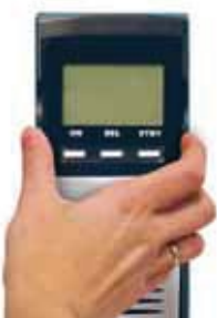
1. Die Anzeigeeinheit herausnehmen